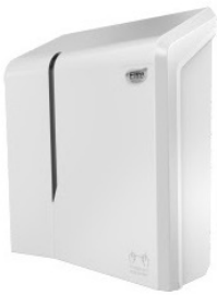
Dispensador Evolution Toalla - Interfoliada 29,5 x 35,5 x 12,5 cm