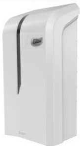
Dispensador Evolution Jabonera - Rellenable 14,5 x 30,0 x 10,5 cm