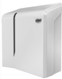
Dispensador Evolution Higiénico - Rollo 28,5 x 31,0 x 13,5 cm