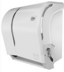
Dispensador Evolution Toalla - Palanca 29,0 x 33,0 x 22,5 cm